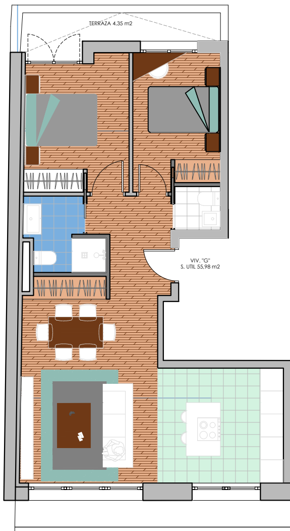
PLANTA 3 VIVIENDA G